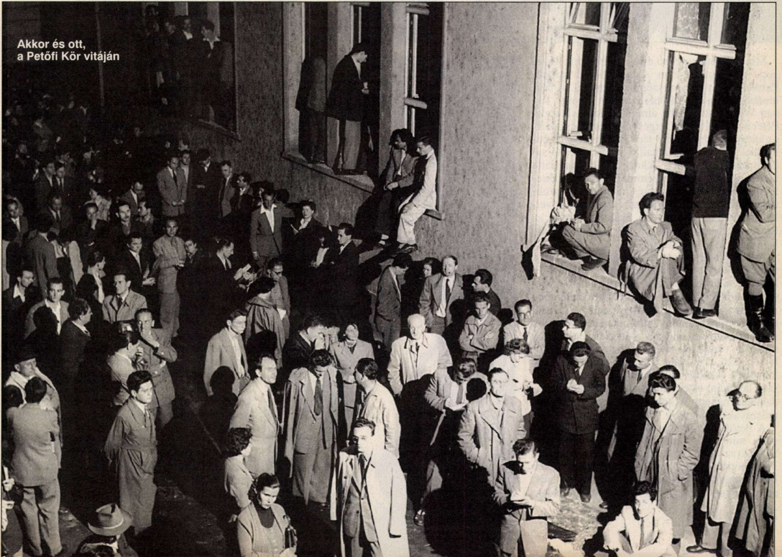
Akkor és ott, a Petőfi Kör vitáján

Akkorra már megjelenik néhány írásom a Csillagban és az Új Hangban, a korszak irodalmi folyóirataiban, így olykor belátogatok az Író-